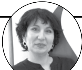
Директор АН «VERANDA»