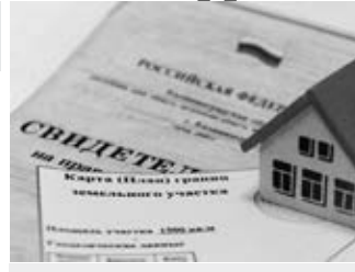
В России останутся только садоводческие и огороднические товарищества.

В законодательстве России нет больше такого понятия, как «дачное товарищество». Вместо пяти взносов владельцам участков теперь надо платить всего два. Плюс в загородных домиках можно оформить регистрацию.