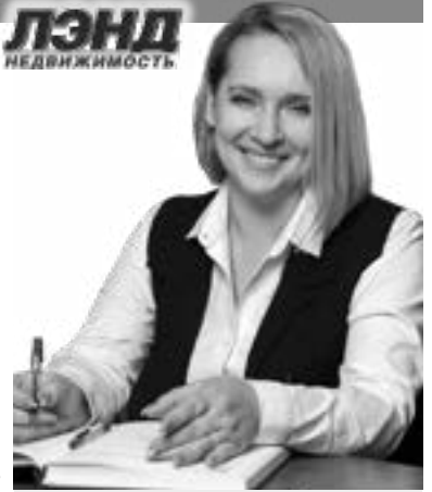
Эксперт по недвижимости